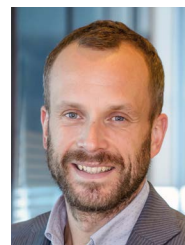
Namens Stichting Ondernemersfonds Utrecht

Business Eiland Utrecht zal zich als trekkingsgerechtigde in deelgebied C blijven inzetten voor de ondernemersbelangen. In beide andere gebieden ben ik in gesprek met initiatiefgroepen die zich op eenzelfde manier willen inzetten voor hun omgeving. Wilt u meepraten over de koers, of heeft u ideeën voor bestedingen in de wijk, laat het ons weten via info@ondernemersfondsutrecht.nl .